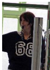
Fabi → Aktuarin schreibt die Protokolle und hält Euch mit dem Newsletter auf dem Laufenden!